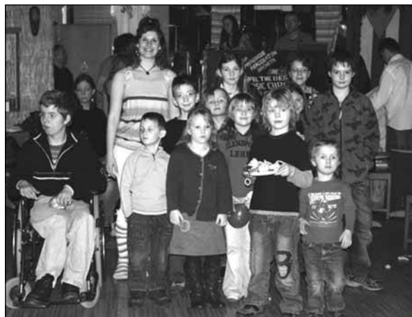
Fotografie ze Srdíčkové párty