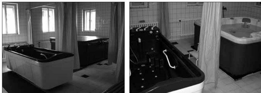
Foto: multifunkční vana, vana na whirlpool