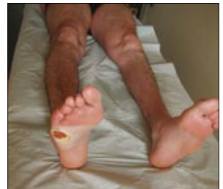
Obr. 6. HSN1 – ulcerace pod hlavičkou V. metatarzu.

Pravděpodobnost detekce kauzální mutace klesá pod 5 %, pokud se vyloučí mutace v PMP 22, GJB 1, PO a MFN-2 genech. Jestliže DNA analýza neprokáže kauzální mutaci zodpovědného genu, není diagnóza CMT choroby vyloučena.