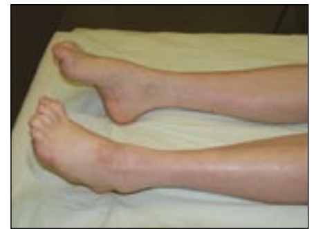
Obr. 3. CMT 1A s typickou deformitou pes cavus, kladívkovými prsty a peroneální atrofií.

Tato forma je způsobena mutací SIMPLE genu [13] a je relativně vzácná. Dosud bylo popsáno pouze šest mutací v tomto genu. Fenotyp je charakterizován nástupem na přelomu 1. a 2. dekády, lehkým pes cavus a distálními svalovými atrofiemi, areflexií L5/S2 a poruchami čítí. Měli jsme možnost vidět matku a dceru s abnormální chůzí (zakopávání, nelze stoj na paty), lehkou deformitou nohou a mírným zkrácením Achillových šlach. Na rukou byly jen naznačeny svalové atrofie se zachovanou jemnou motorikou prstů. Elektrofyziologické studie jsou zajímavé přítomností