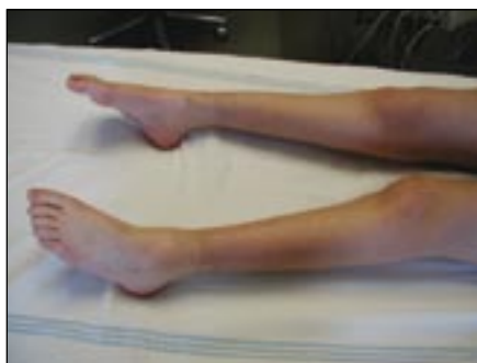
Obr. 4. CMT 2A s těžší chabou paraparézou od 1. dekády.