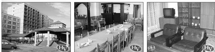
Potvrzení účasti na semináři Společnosti C-M-T dne 6.10.2007 v Klimkovicích