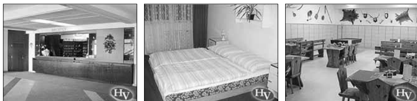
Přihláška na podzimní víkendové setkání Společnosti C-M-T ve dnech 5.10 – 7.10.2007 hotel Vista Ostrava