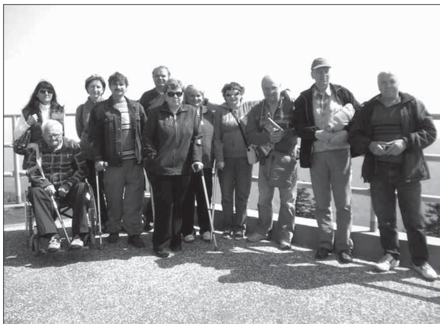
Víkendové setkání v Beskydech.