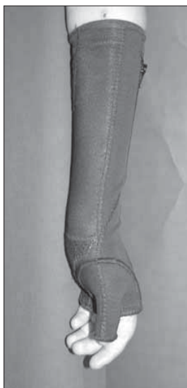
S lykrovou rukavicí